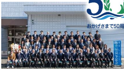
創立50周年記念写真撮影の様子

本社 TEL 042(355)7702 東京営業所/特需開拓課 海外営業部/JR開発グループ 南九州支店 TEL 099(255)0601 沖縄支店 TEL 098(898)7200 大阪営業所 TEL 072(778)8031 北九州営業所 TEL 092(894)3001 札幌出張所 TEL 011(817)8830 東北出張所 TEL 022(728)1061 大隅出張所 TEL 099(255)0601