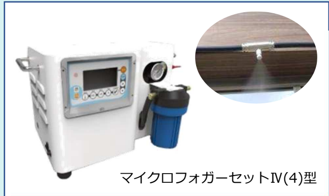
マイクロフォガーセットIV(4)型