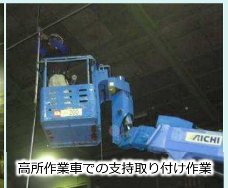
高所作業車での支持取り付け作業