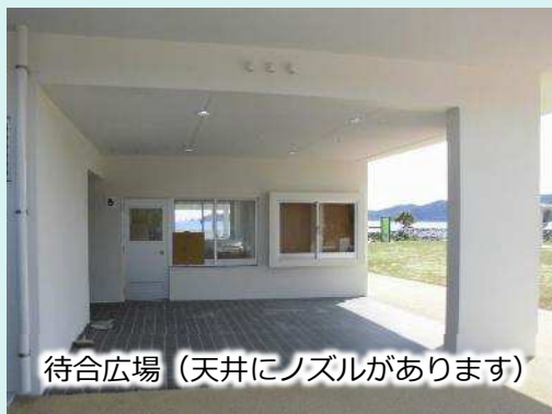
待合広場（天井にノズルがあります）