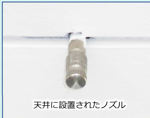
天井に設置されたノズル