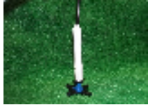
フオーグ-ASSY(チューブ付)