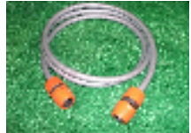
ワンタッチ継手付ホース