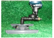
間断タイマー(H型ベース付)