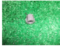
φ8チューブ継手用袋ナット