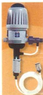
2512 薬液バイパスタイプ 空気弁付