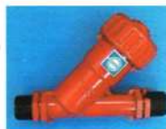
ファーターガード