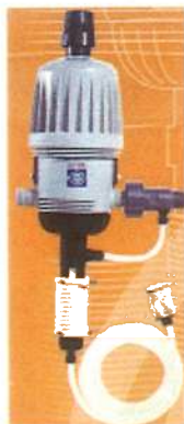
12512 薬液バイパスタイプ ON/OFF 機能付