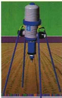
大口径2" ミックスライト TF-15