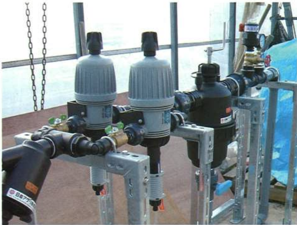
二液混入設置事例