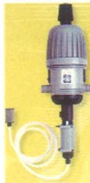
12502 普及タイプ ON/OFF 機能付