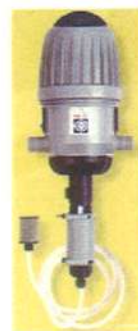
2502 普及タイプ 空気弁付